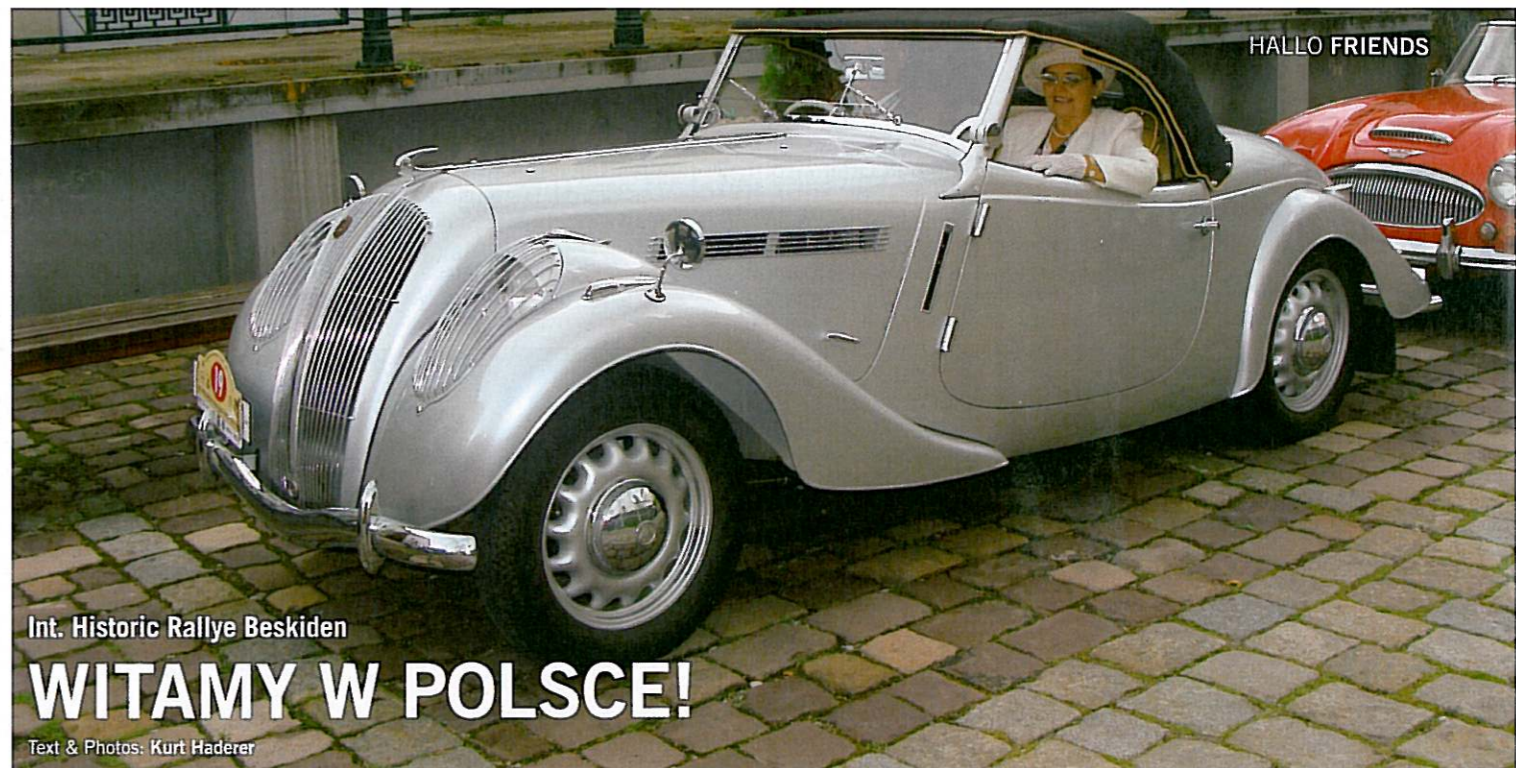
Int. Historic Rallye Beskiden

Die Strecke führte die Rallyepiloten durch unwegsames Gelände und extreme klimatische Bedingungen: Klirrende Kälte in Schweden, Hitze und Staub in Kenia, brutaler Schotter in Griechenland. Hunderttausende Fans pilgerten zu den Rallyepisten – allein um den schier unglaublichen Motorensound zu hören oder in der Staubfahne der oft nur Zentimeter entfernt vorbeirauschenden Wagen zu stehen. Näher konnte man dem Rennsport als Zuschauer kaum kommen. Doch wo es keine Grenzen gibt, da fehlt oft das Maß. Das gegenseitige Wettrüsten der Hersteller sowie das fehlende Sicherheitsdenken der Rallye-Organisatoren führten am Ende zu tragischen Unglücksfällen. Als man die „Gruppe B“ aus Sicherheitsgründen schließlich 1986 durch ein neues Reglement ablöste, endete damit eine Epoche, die den Rallyesport wie keine andere beeinflusst hatte.