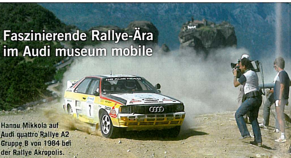
Hannu Mikkola auf Audi quattro Rallye A2 Gruppe B von 1984 bei der Rallye Akropolis.

Zum 100-jährigen Geburtstag der Marke Audi blickt das Unternehmen mit den Vier Ringen auf eine aufregende Ära im Rallyesport zurück. In der Sonderausstellung „Die Quer-Lenker: Rallyefahrzeuge der Gruppe B“ präsentiert Audi Tradition von 12. August bis 31. Oktober 2009 im Audi museum mobile in Ingolstadt insgesamt 12 Rallyefahrzeuge aus der Zeit von 1983 bis 1986 – mit einer Gesamtmotorleistung von über 5.000 PS.